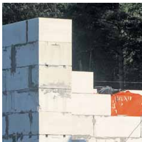
Газобетон изготавливается в виде легких крупноформатных блоков. Малый вес позволяет легко транспортировать этот строительный материал, а большой размер значительно ускоряет кладку стены.

климата доходит до 20%. После увлажнения дождем газобетон, в отличие от древесины, быстро высыхает и не коробится. В отличие от кирпича, газобетон не впитывает воду, поскольку капилляры прерываются сферическими порами. Пористая структура обеспечивает также высокую морозостойкость газобетона, поскольку вода, превращаясь в лед и увеличиваясь в объеме, имеет место для расширения, без угрозы разрыва материала.