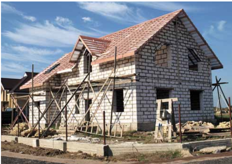
Ежегодно из газобетона возводятся многие тысячи построек и в городской черте, и в пригороде.

Несмотря на то что газобетон – высокопористый материал, он не является гигроскопичным, то есть слабо впитывает воду. Равновесная влажность газобетонных стен в Санкт-Петербурге, по данным многочисленных исследований, находится в пределах 5–6 % по массе. А тот же показатель стен из сосны и ели в условиях нашего влажного