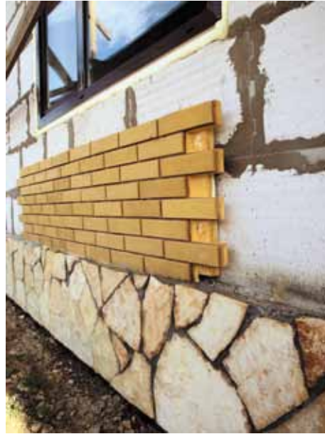
Стены и цоколи из газобетона могут отделываться практически любым облицовочным материалом.

Внутреннюю отделку желательно тоже делать паропроницаемой. Для этого важно подобрать соответствующие материалы, один из которых – та же штукатурка. Понятно, что пароирующую отделку